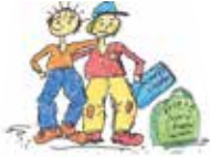
ESCOLA POMPEU FABRA